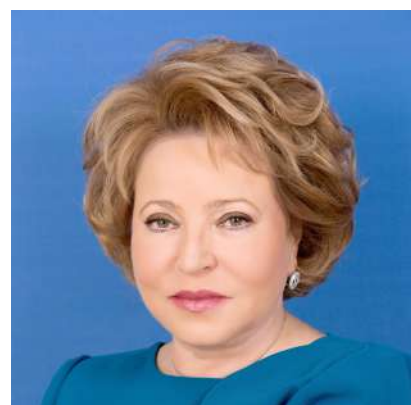
Валентина Ивановна Матвиенко Председатель Совета Федерации Федерального собрания РФ

«Тема фестиваля «Исторический и современный ландшафт в контексте городской среды» сегодня как нельзя остро актуальна, она показывает нам, что охрана исторических ценностей – это непреходящая задача культурного развития».