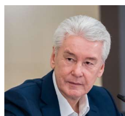
Сергей Собянин Мэр Москвы

«Проведение подобных мероприятий сегодня очень актуально. Фестиваль нужен как профессиональному сообществу, так и собственникам участков, инвесторам и девелоперам. Для жителей России – это шанс увидеть, насколько широки возможности работы с исторической средой».