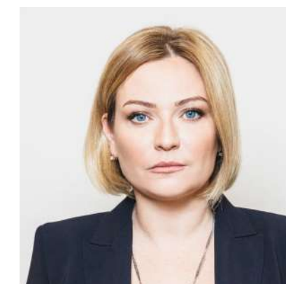
Ольга Борисовна Любимова Министр культуры Российской Федерации

«Желаю гостям и всем участникам фестиваля плодотворной работы, интересных дискуссий и вдохновения! Сохранение архитектурного наследия – наш общий долг перед нашими предками и потомками».