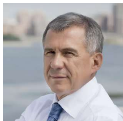
Рустам Минниханов Президент Республики Татарстан

«Российские города и территории нуждаются в особой защите и возрождении культурно значимых объектов, ведь именно с них берёт начало богатая история нашей страны. Как сохранить эти уникальные исторические ландшафты и градостроительную среду, подготовить специалистов, способных перенять мастерство лучших архитекторов-реставраторов, – это ключевые темы дискуссий фестиваля».