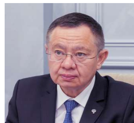
Ирек Файзуллин Министр строительства, архитектуры и жилищно-коммунального хозяйства Республики Татарстан

«Тема фестиваля «Исторический и современный ландшафт в контексте городской среды» сегодня как нельзя остро актуальна, она показывает нам, что охрана исторических ценностей – это непреходящая задача культурного развития».